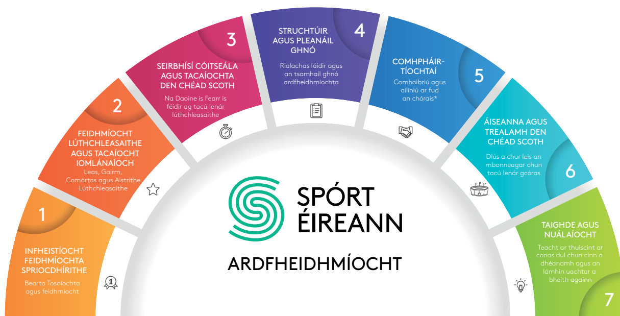
Fíor 1. Seacht gColún Straitéiseacha na Straitéise Ardfheidhmíochta (2021-2032)

Cuirfear an Straitéis Ardfheidhmíochta i gcrích i gcomhpháirt leis an bpobal ardfheidhmíochta trí chéile. Tá an straitéis seo bunaithe ar bhéim atá á leagan ar sheacht gcolún straitéiseacha (Fíor 1).